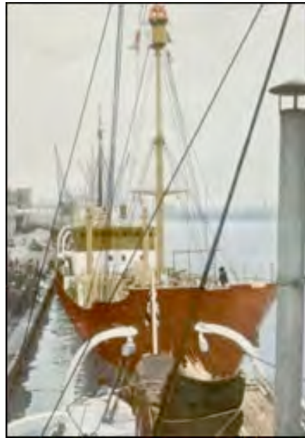
De Polarhav verlaat de haven van Antwerpen

Zestig jaar nadat de Belgica de haven van Antwerpen verliet voor zijn historische reis naar Antarctica, werd er opnieuw een Belgische Zuidpoolexpeditie voorbereid. Aanleiding hiervoor was het Internationaal Geofysische Jaar. Twaalf landen namen eraan deel. Tussen 1 juli 1957 en 31 december 1958 zetten ze geofysische waarnemingsprogramma's op in Antarctica. Tijdens deze periode was de zonne-activiteit het grootst. België nam deel aan het project. Gaston de Gerlache , de zoon van Adrien, leidde de tweede Belgische Antarctica-expeditie uit de geschiedenis.