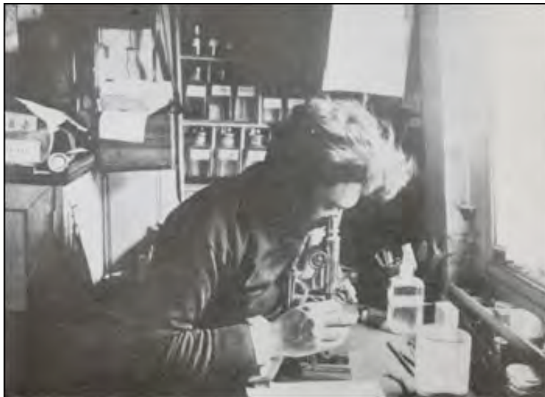
Emile-Gustave Racovitza in zijn laboratorium

Op 18 mei ging de zon onder om zich enkele maanden niet meer te laten zien: de poolnacht was ingetreden. De expeditie leed erg onder de omstandigheden. Tijdens de poolnacht werd de bemanning aangetast door moedeloosheid, gezwollen ledematen, onregelmatige en zwakke polsslagen, hoofdpijn en depressie. Volgens Frederick Cook kwam dit door een combinatie van gebrek aan vers voedsel en zonlicht en geestelijke depressie. "De poolanemie liet verwoestende sporen op ons na" , schreef eerste stuurman Lecointe. "Onze gezichten zijn getrokken, diep gegroefd en slaan groenig uit. Onze ogen zijn dof en levensloos. Het kostte slechts een ononderbroken nacht van 1600 uur om oude mannen van ons te maken..." .