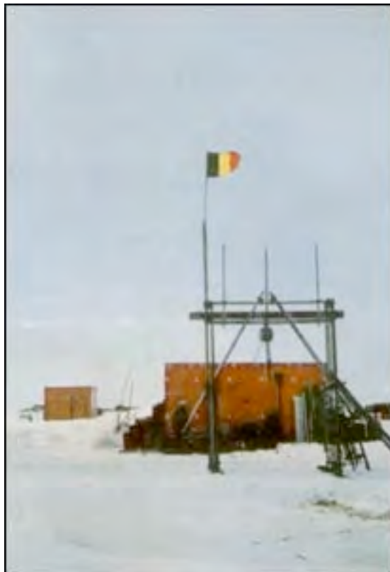
De Koning Boudewijnbasis

Naast wetenschappelijk onderzoek op de basis zelf, trokken de expeditieleden er ook af en toe op uit. Het Antarctische binnenland was nog grotendeels terra incognita en dit mocht natuurlijk niet zo blijven.