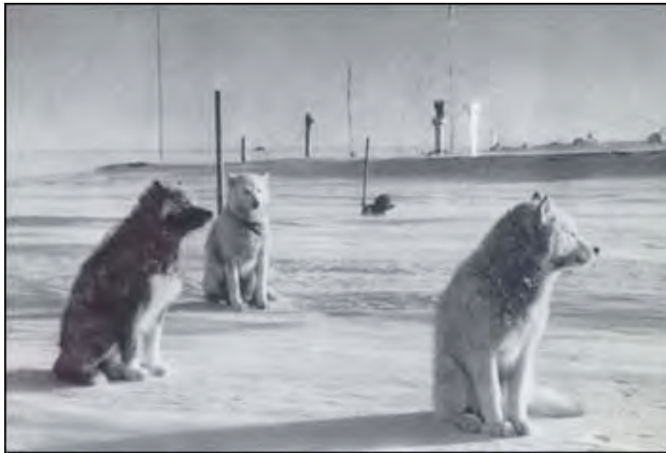
De ingesneeuwde Koning Boudewijnbasis

Dit hoofdstuk brengt een kort overzicht van de Belgische aanwezigheid op Antarctica.