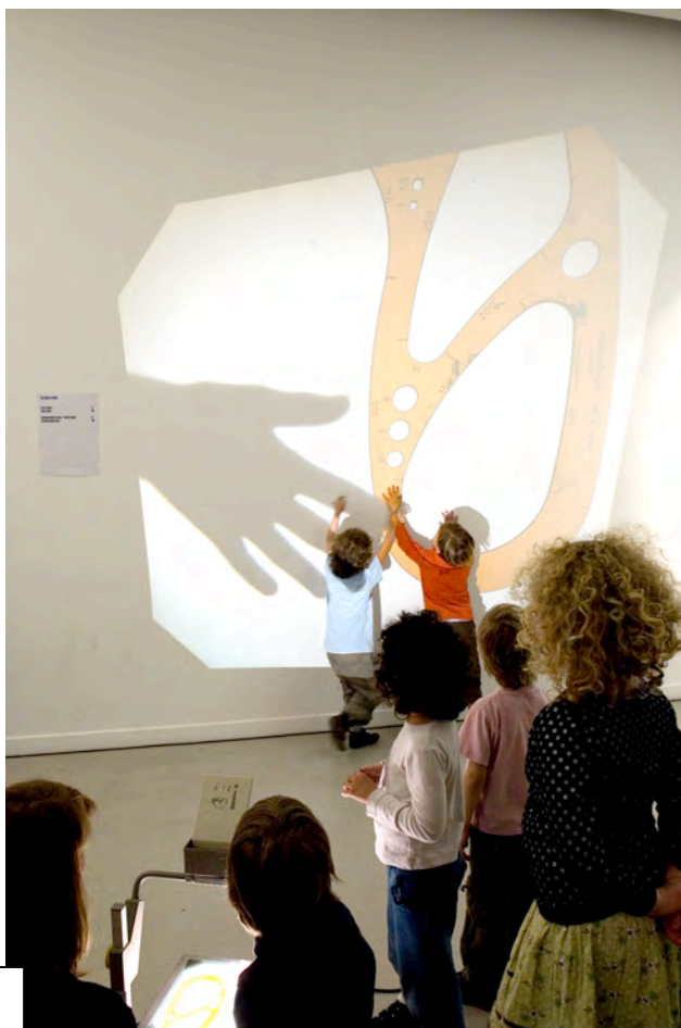
De lichtshow voor de Muhkamodeshow!